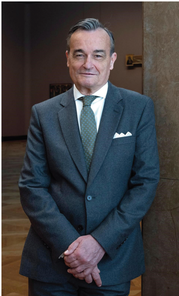
Crédit photographique : GERARD ARAUD Ferrante_Ferranti-Amis_du_Louvre

Dans un contexte mondial marqué par le retour des empires et une instabilité croissante, FactoFrance choisit de donner la parole à Gérard Araud, figure incontournable des relations internationales.